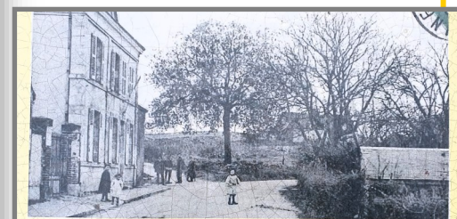
Route d'Orléans, vers 1910/1920 : la Mairie/Ecole des garçons et le chêne planté vers 1870