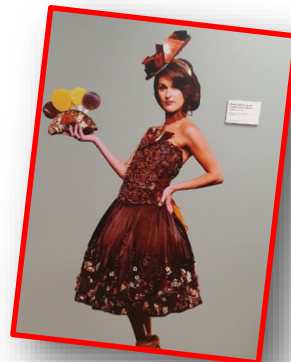
La chocolaterie (tière)