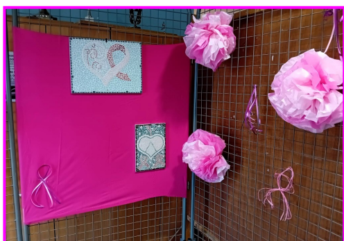
La déco (mozaïques, ponpons ...)