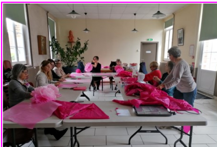
La préparation des décors, en rose !