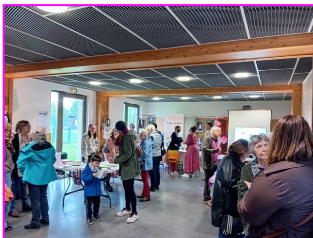
Le hall d'expo