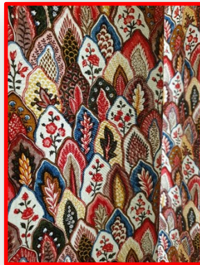
Toile de Jouy, Jouy en Josas