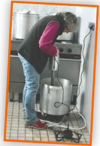
Les corvées ...