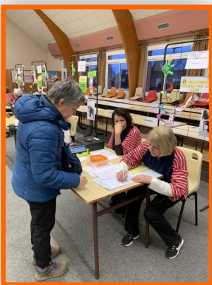
... Mais aussi le plaisir et la bonne humeur